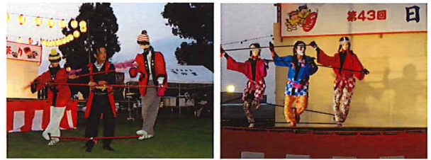
じっとしちやお連様