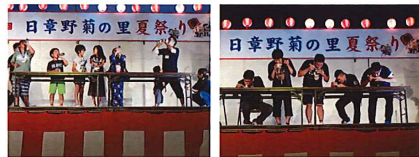
ラムネ早飲み・カップ麺早食い競争